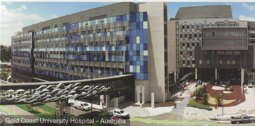
Gold Coast University Hospital - Australia