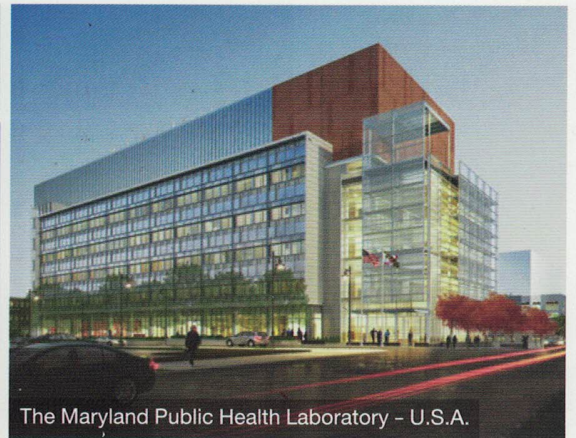
The Maryland Public Health Laboratory - U.S.A.