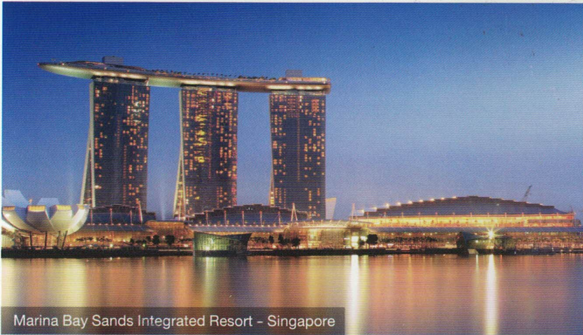
Marina Bay Sands Integrated Resort - Singapore